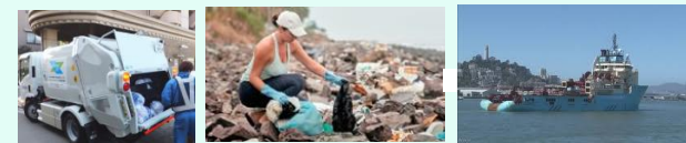
ゴミ回収 & 搬入者(国/行政/団体/業者)