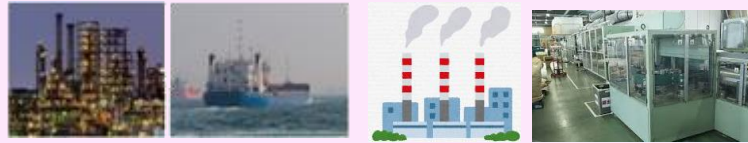
化石燃料の精製企業