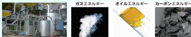
エネルギー変換処理者 (油化/炭化/ガス化)